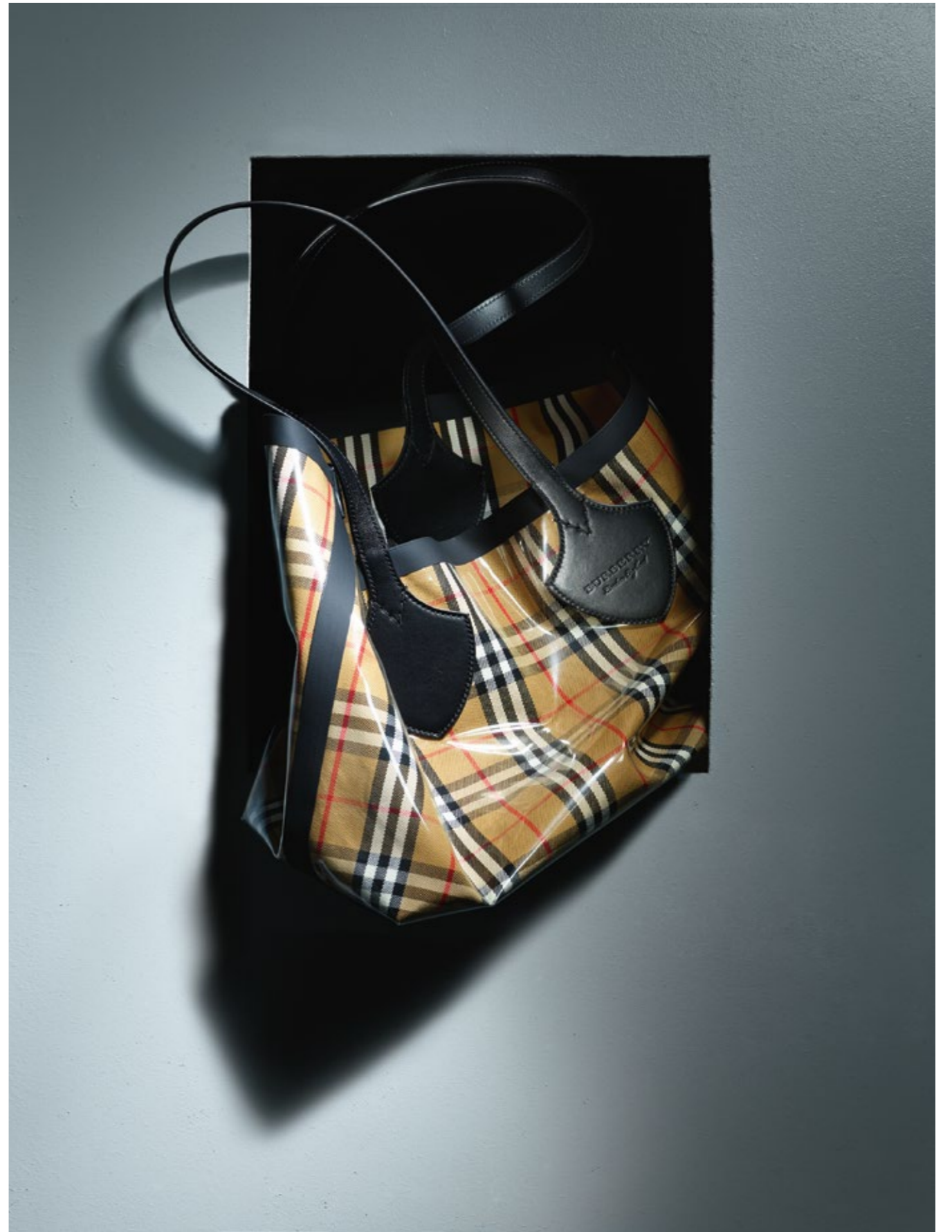
BURBERRY Cabas vinyle XL, en tartan et cuir réversible.