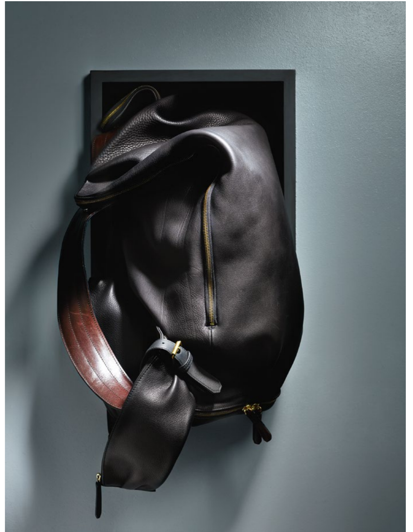
VINCENT GARSON Le Dune, sac à dos souple et structuré, ergonomique, en veau sellier carbone. Équipé d'un chargeur solaire. Disponible en 2 tailles, King et Queen.