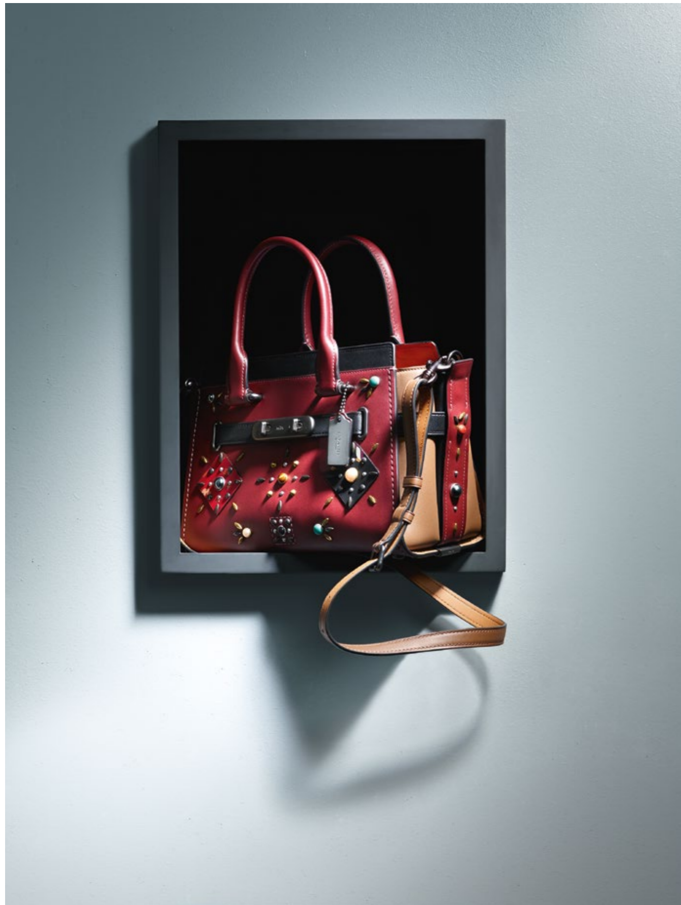
COACH Sac en cuir avec breloques et bandoulière ajustable.