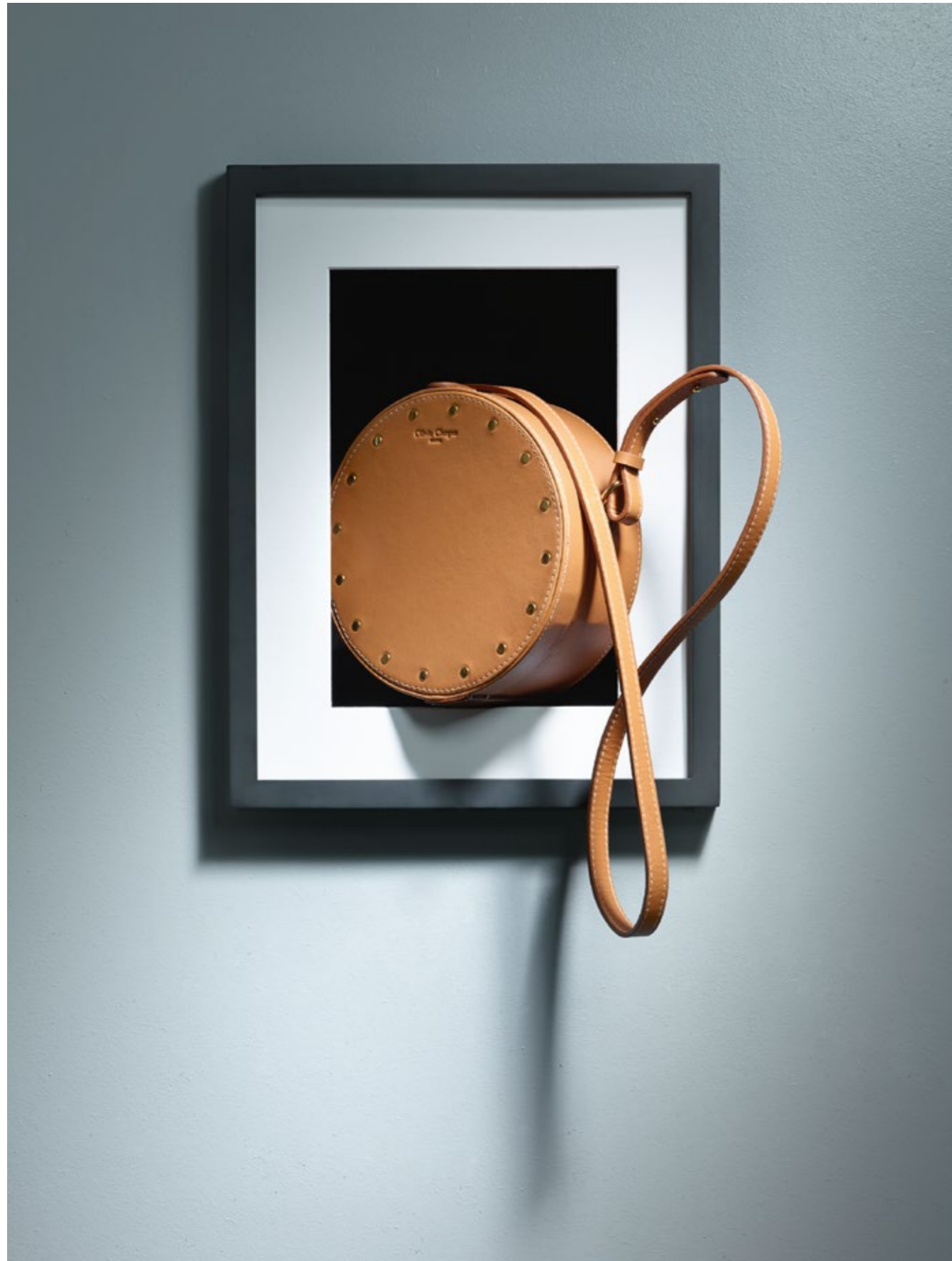
OLIVIA CLERGUE Sac en cuir naturel.