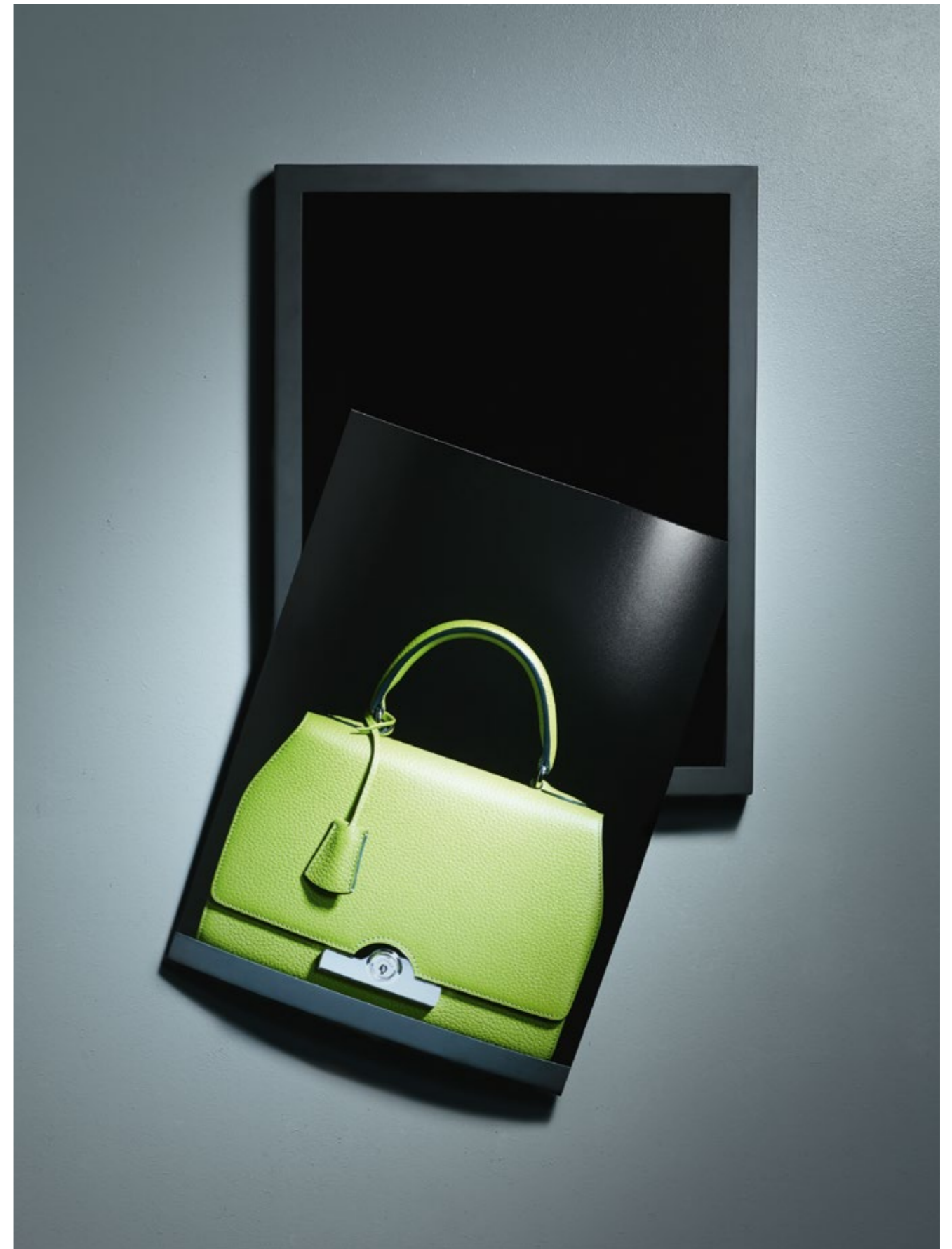
MOYNAT Mini Rejane, sac à main en Taurillon Gex avec détails argentés et doublure veau perle.