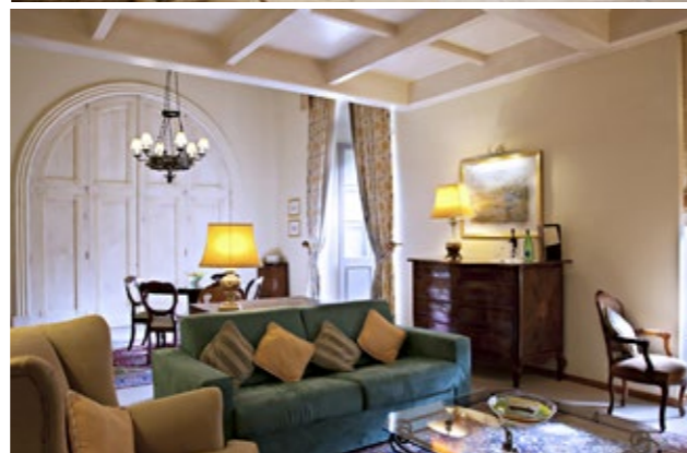
Marsaxlokk sur l'île de Malte