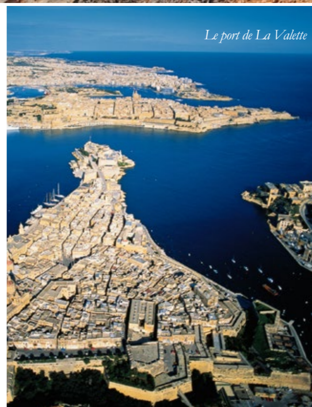
Le port de La Valette