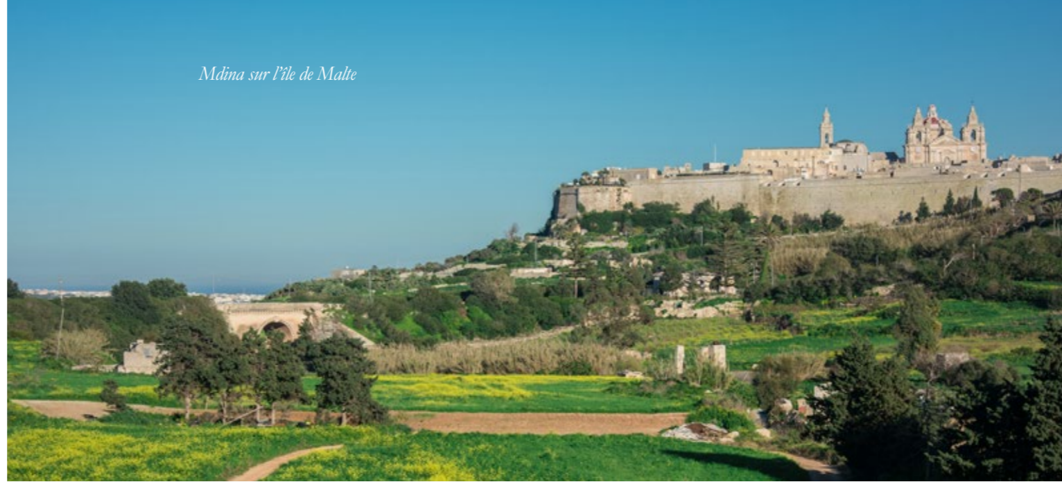
Mdina sur l'île de Malte

www.franceculture.fr/emissions/villes-mondes/la-valette-ville-mondes-escale-2