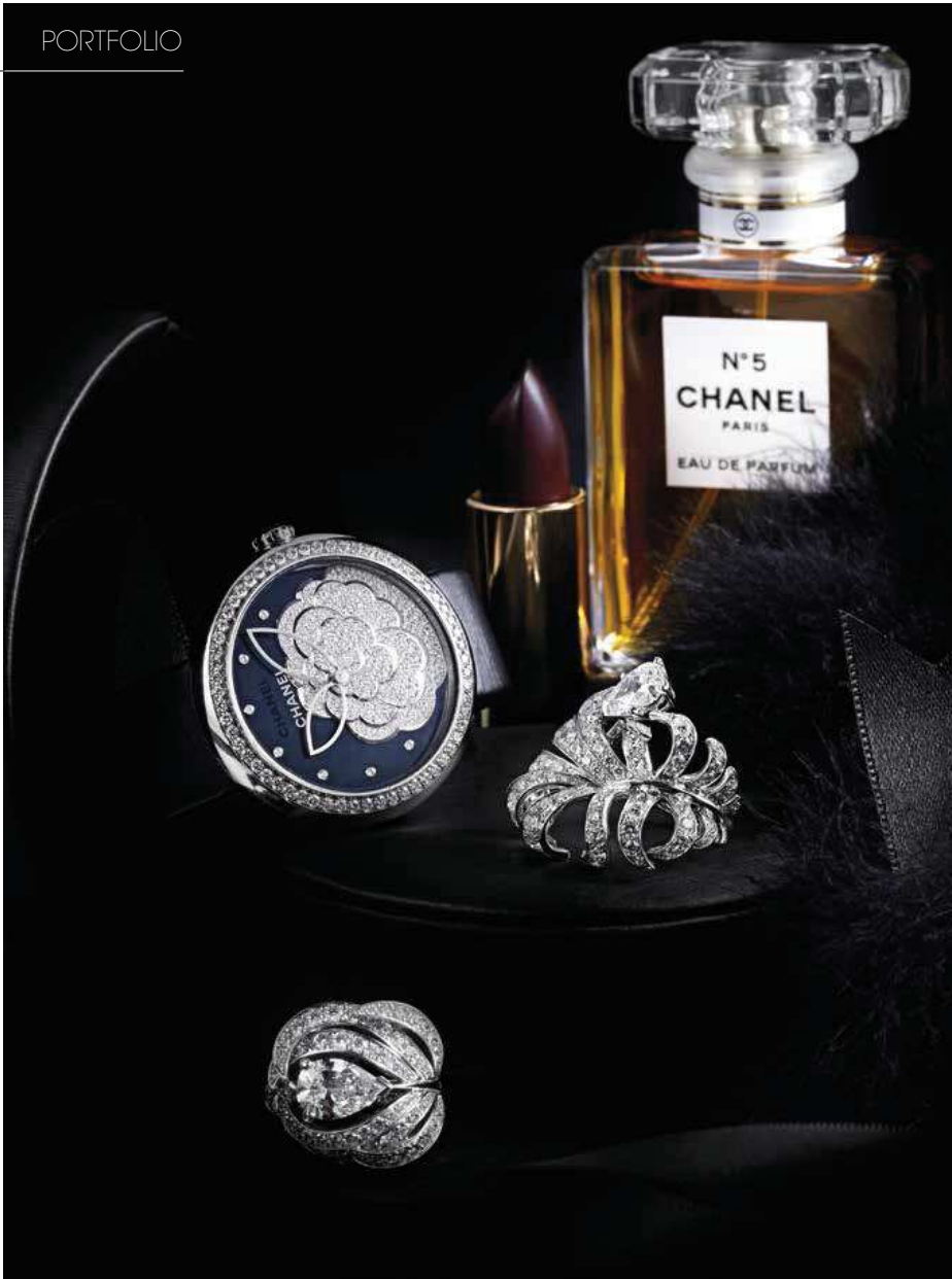
Chanel Joaillerie. Montre camélia en or blanc et sertie de diamants. Bague plume en or blanc et diamants. Bague en or blanc et diamants Chanel. Eau de parfum. Ofée. Ecrins.