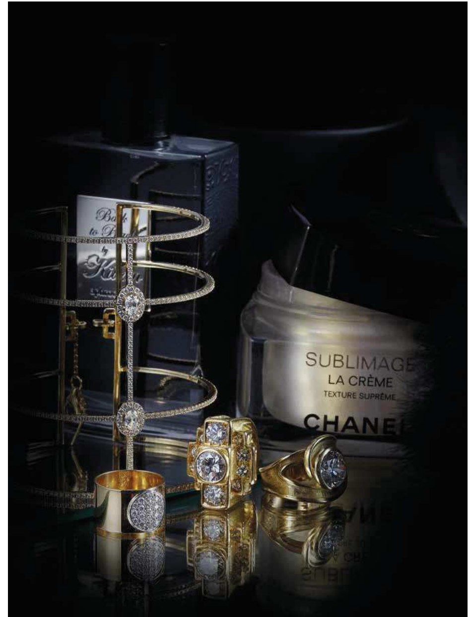
Amazone. Manchette en or jaune et diamants. Hélène Courtaigne Delalande. Bagues en or jaune et diamants. Dinh Van. Bague Anthéa en or jaune et diamants. Chanel. Soins Sublimage.