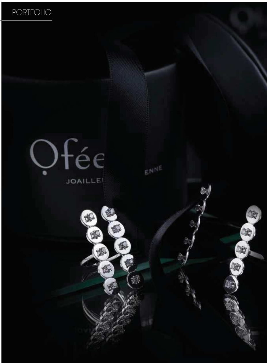
Ofée. Bague et bracelet de la collection Only en or blanc et diamants. Ecrins.