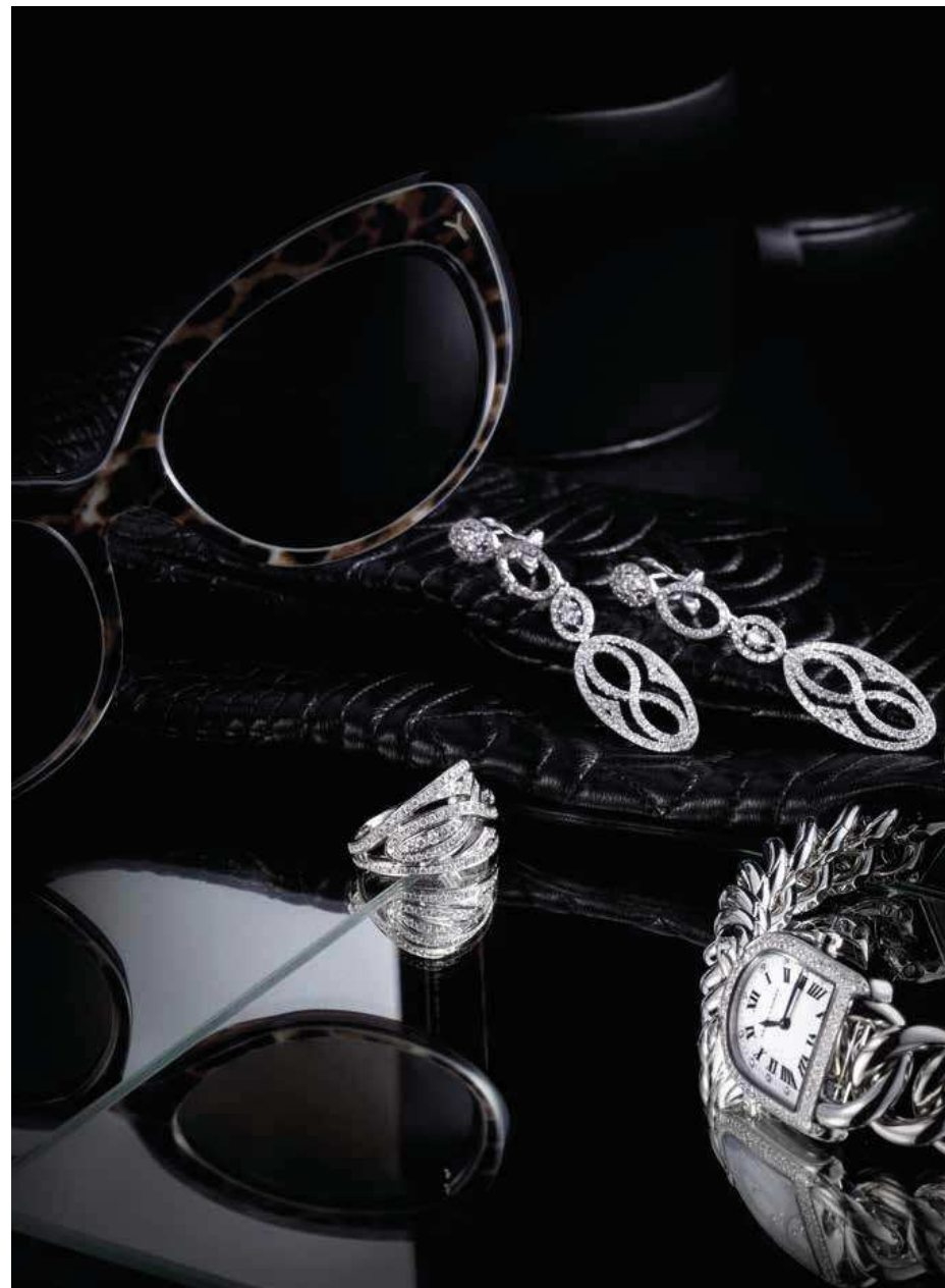
Bucherer. Bague et boucles d'oreille en or blanc et diamants. Ralph Lauren. Montre modèle Petite Link en acier et serti neige de diamants. Agnelle. Gants.